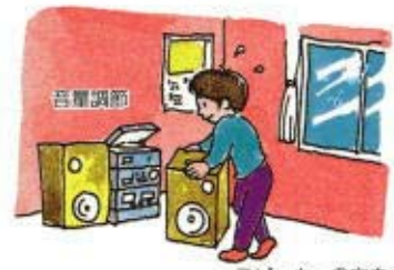
スピーカーの向き

エアコン、ボイラーなどは音の小さい機種を選ぶとともに、取付の位置や方向に気をつけましょう。