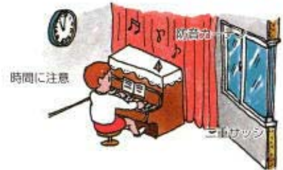
防音マット・じゅうたん